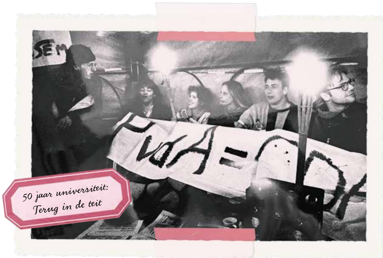
Hongerstakers in kiosk op het Vrijthof in 1993