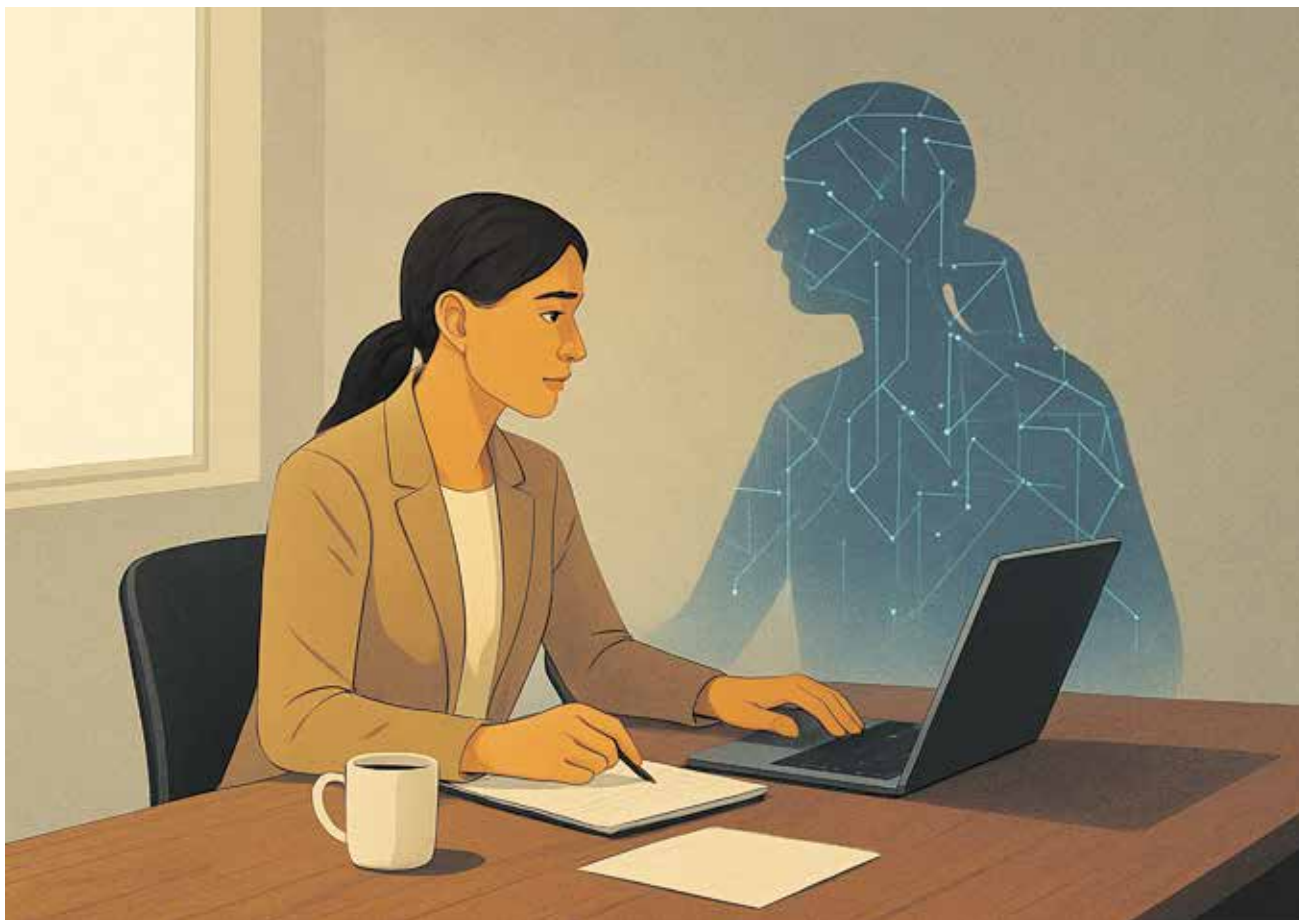
Uit studies blijkt dat mensen AI steeds meer als collega zien. Voor de gelegenheid vroeg Observant ChatGPT om een afbeelding bij dit stuk te genereren